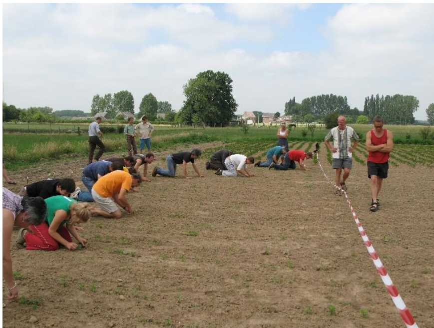
Foto: Wiedwedstrijd op afstudeerfeest

Eind juni organiseren we voor 't eerst het afstudeerfeest van de Landbouwopleiding (Leertraject) op een landbouwbedrijf in combinatie met een mid-zomerviering. Een geslaagde formule die gepaard gaat met de inrichting van het 1 e Vlaams Wiedkampioenschap .