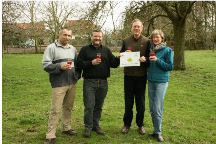
Foto: sponsoring door Pajottenlander

jaar ook met een nieuw sponsoring-project waarmee we onze afhankelijkheid van overheidssubsidies minder groot willen maken. Het krijgt de naam 'Bio-Training-Project' en krijgt ook een eigen logo. Pajottenlander sappen wordt de eerste sponsor.