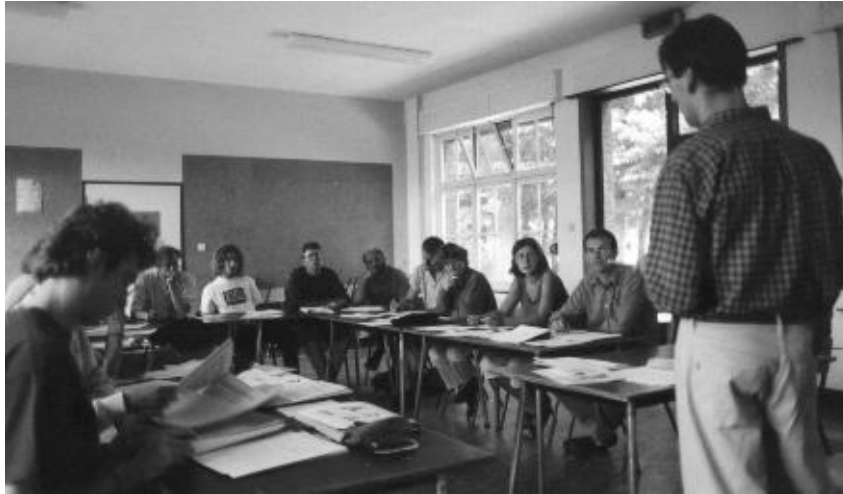
Foto: les bodemkunde in Merelbeke

De samenwerking met de Nederlandse Warmonderhofopleiding laat toe ervaren docenten naar Vlaanderen te halen en gedeeltelijk & onrechtstreeks subsidies te ontvangen. De samenwerking met het VAC maakt het mogelijk een officieel erkende en gesubsidieerde Starterscursus in de landbouw (Vlaams Ministerie van Landbouw) te integreren in de opleiding.