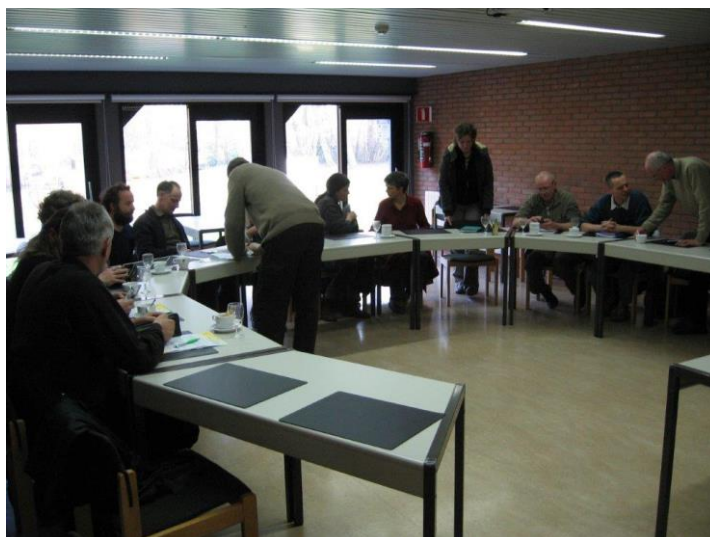
Foto: Studiedag bedrijfsopvolging

In september start de 10 e cyclus van onze landbouwopleiding. We zetten ook de eerste stappen naar een vormingsaanbod voor biowinkeliers.