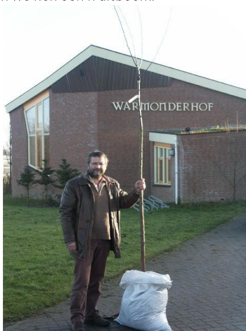
Foto: Geschenk aan Warmonderhof als dank voor de samenwerking

Tegelijk wordt de jarenlange samenwerking met de Nederlandse Warmonderhofopleiding beëindigd. Als dank schenken we hen een fruitboom.