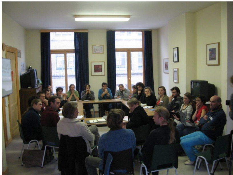
Foto: CSA conferentie

In de voorbije jaren hebben we actief de opstart van het Vlaams CSA-Netwerk ondersteund en in december organiseren we samen met het CSA-netwerk de 1 e CSA-conferentie in Vlaanderen.