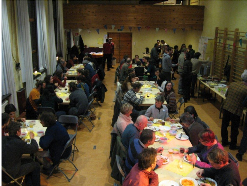
Foto: Quiz-avond in Gent

Als hartverwarmende winter-activiteit organiseren we voor de 2e keer in februari een druk bijgewoonde quiz-avond.